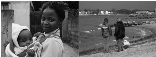
Mütter und ihre Babys werden auch nach der Geburt weiter betreut. — Familien brauchen Erholung vom belastenden Alltag.

Menschen mit HIV und AIDS brauchen weiterhin unsere Hilfe: In Deutschland leben zurzeit rund 70.000 Menschen mit dem Virus, so viele wie nie zuvor. Trotz verbesserter Therapiemöglichkeiten geht es vielen Betroffenen gesundheitlich und finanziell sehr schlecht. In diesen Notlagen hilft die Stiftung, indem sie dringend benötigte Anschaffungen, Krankenreisen und Projekte fördert – zum Beispiel ein Wochenende für betroffene Mütter und ihre Kinder an der Ostsee.